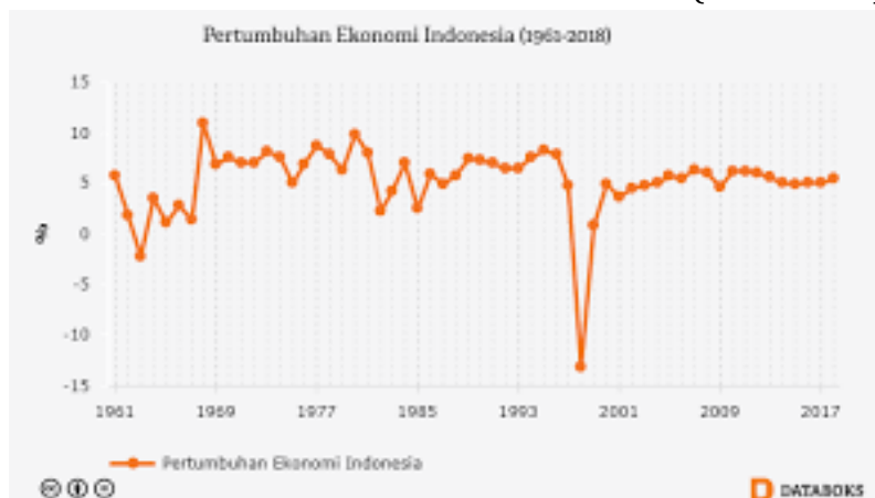
Gambar 1. Pertumbuhan Ekonomi Indonesia (1961-2018)

Pada Tahun 1998 Indonesia mengalami peristiwa besar yang memberikan dampak serius bagi Indonesia. Peristiwa tersebut yaitu Kerusakan Mei 1998. Penyebab dari peristiwa tersebut salah satunya yaitu keruntuhan ekonomi Indonesia sebagai akibat dari krisis keuangan di Asia. Krisis keuangan di Asia ini dipicu oleh devaluasi baht Thailand pada Juni 1997, yang kemudian menyebar ke wilayah wilayah Asia lainnya, khususnya di Asia Tenggara. Di Indonesia, krisis keuangan tersebut berada dipuncaknya pada tahun 1998. Gambar 1 menunjukkan pada tahun 1998, pertumbuhan ekonomi Indonesia berada pada titik terendah yaitu -13,13%. Ini artinya, Indonesia mengalami peristiwa yang cukup serius.